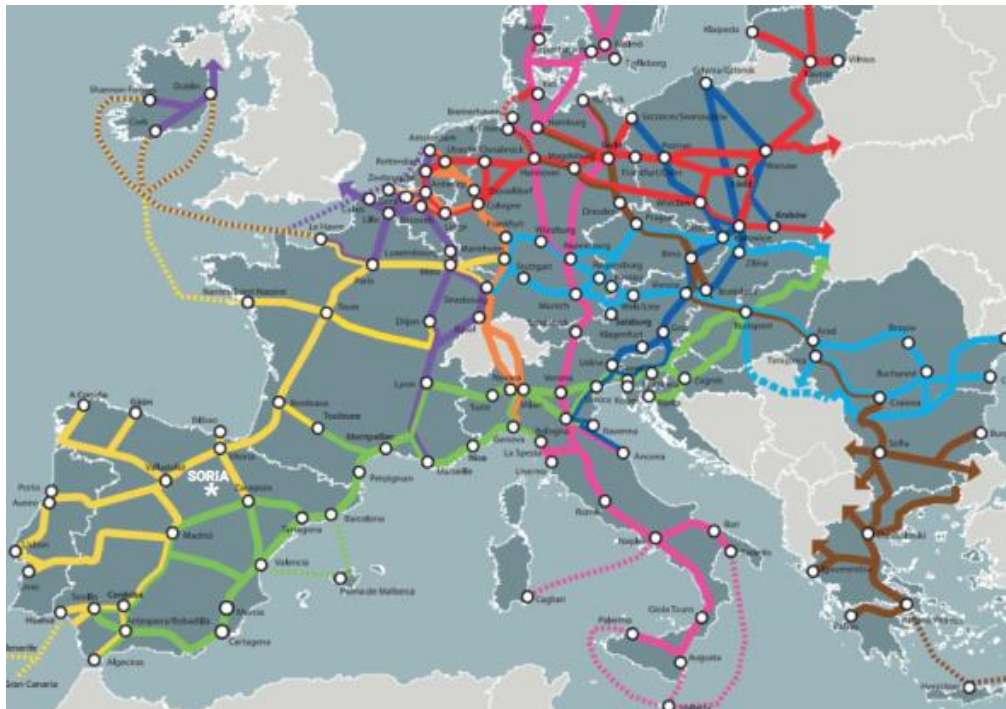
Figura 2. Mapa de la red Transeuropea de Transporte TEN-T

b. Conectividad y telecomunicaciones. La accesibilidad a Internet y a las nuevas tecnologías es fundamental para garantizar el acceso a la información y la competitividad económica y social de las regiones más despobladas. En primer lugar, para dar datos relativos a la cobertura, una de las grandes problemáticas es que en la legislación y las distintas convocatorias se habla en términos de población y