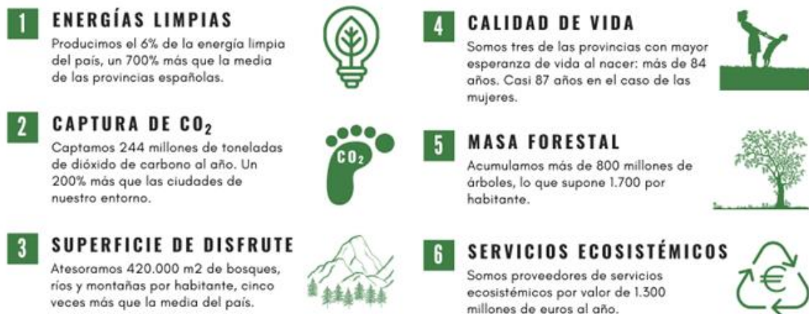
Figura 3. Parte del folleto “Territorios donantes de vida” realizado por la Red SSPA

b. Generar herramientas para medir el valor multifuncional de los territorios y de sus servicios ecosistémicos que permitan evaluar y cuantificar económicamente la contribución de los mismos, a fin de implementar compensaciones económicas objetivas. Además de evaluar y cuantificar económicamente su contribución, sería beneficioso vincular estos valores a programas de compensación económica. Por ejemplo, se podrían establecer mecanismos que permitan a las empresas compensar sus emisiones de carbono invirtiendo en proyectos de conservación de territorios con externalidades positivas.